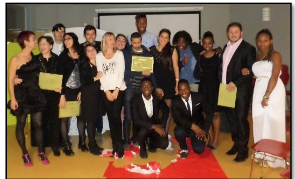
Toute l'équipe d'Anim'Action lors de la soirée de clôture

Samedi 30 novembre et samedi 7 décembre : préparation de la soirée sur le thème « Festival de Cannes ».