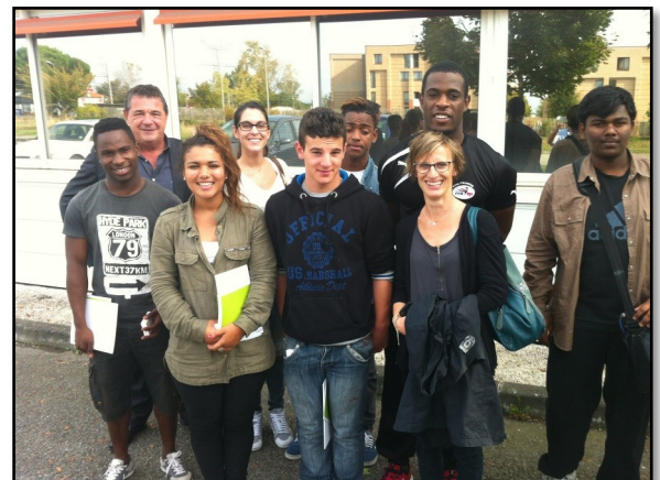
Visite d'entreprise chez FOURNIE GROSPAUD, filiale VINCI ENERGIES SUD OUEST