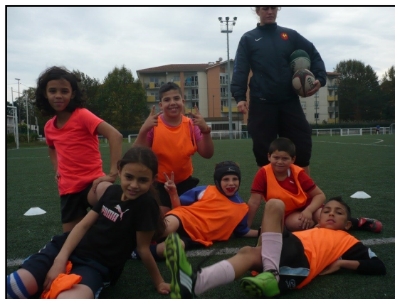
Photos : Stage de la Toussaint