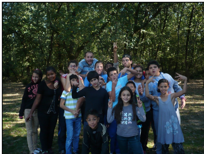
Sortie à la forêt de Bouconne