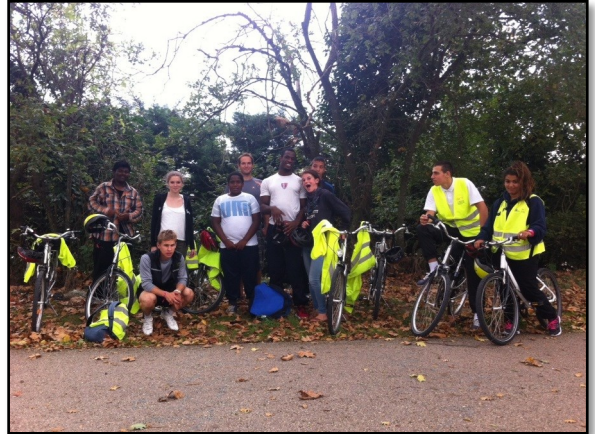
Sortie à vélo avec la Maison du Vélo