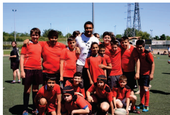
Thierry DUSAUTOIR pose devant l'objectif de Rebonds! avec l'ITEP Les 4 Vents et l'ITEP Saint Simon.