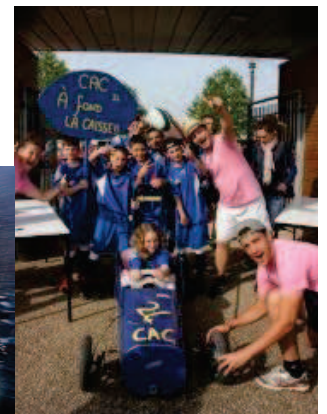
Présentation des mascottes