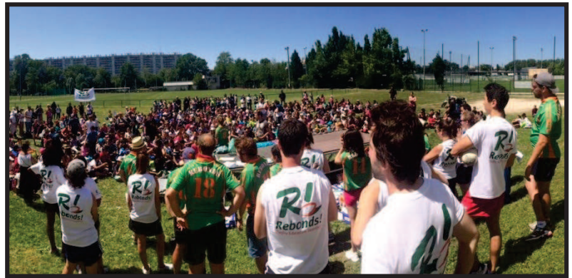
Tournoi des écoles juin 2014