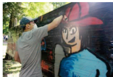
Séance de graffiti le vendredi