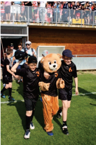
Défilé avec les mascottes

Co-organisé par l'association Rebonds! et l'AIRE (Association des ITEP et de leur Réseau), chaque année le projet est aussi porté par un ITEP local. Cette année c'est l'ITEP Jean Laporte qui a accueilli l'événement. Toutes les équipes ainsi que les organisateurs et bénévoles ont séjourné à Mirefleurs durant trois jours, du vendredi 13 juin au dimanche 15 juin 2014.