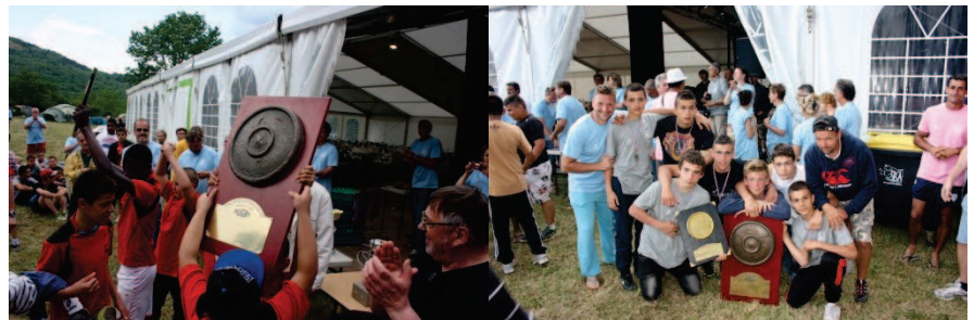
Les vainqueurs en moins de 13 ans : ITEP La Maison des Enfants à Oullins (69)